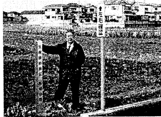
営農を支援する生産緑地指定水田・貴志地区で