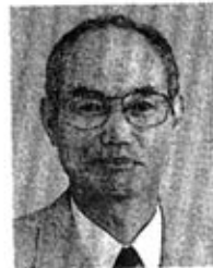
大 舛 主 馬 市 議

砂山連合自治会を中心 としてとりくんだ施設建 設反対署名は11万人を越 え、昨年市に提出しました。