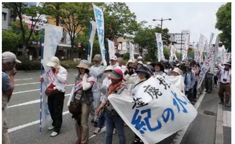
(6月26日、計画に反対する160名の住民のデモ行進)

*質問終了後、市長は23日に担当課と共に計画地に登られました。また、6月27日、山口連合自治会は14万4869筆の署名を市長に直接提出しました。