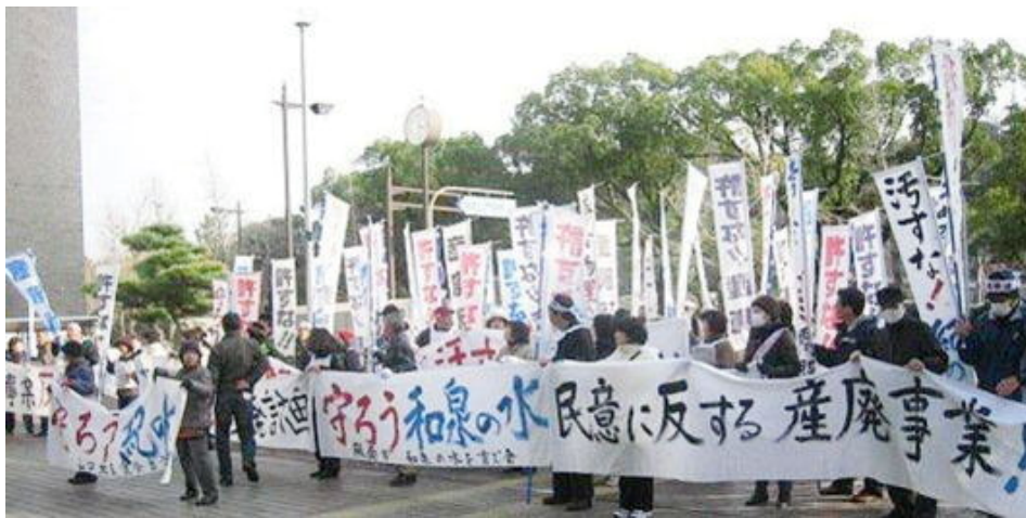
(2月16日、市役所前での産廃処分場計画反対の集会)

のために南谷池下流の水路などに流す場合、「水利権者の同意が必要」だといふことが、私の一般質問で明らかになりました。質疑の要点は次のとおりです。