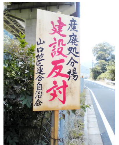
山口地区の「建設反対」看板