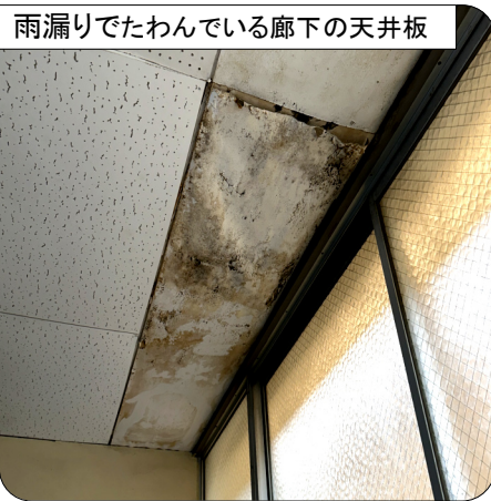
雨漏りでたわんでいる廊下の天井板

南畑..教育施設は築40年以上が66%です。教育現場から雨もりや床の改修等を求める声が多数出ていることから、予算を増額し早期に改修すべきです。