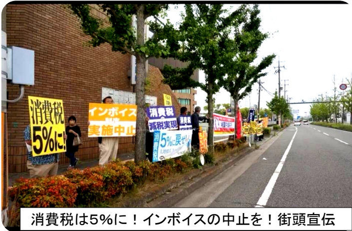
消費税は5%に！インボイスの中止を！街頭宣伝