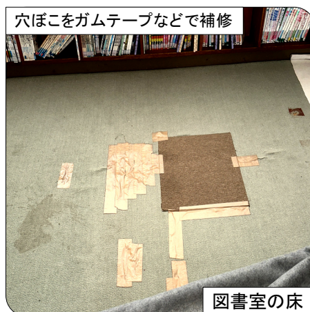
穴ぼこをガムテープなどで補修