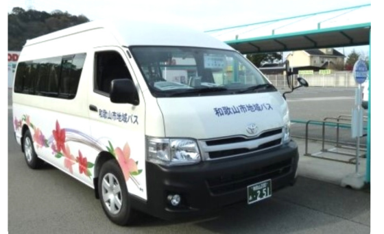
現在、紀三井寺地域で走っている地域バスです。

質) 「川永地区」は、商業施設が閉店し秋頃に新たな商業施設が入居予定と聞いている。その時期に合わせて、本格運行とすべきではないのですか。 答) 秋頃に新たな商業施設が入居見込みではあるが、