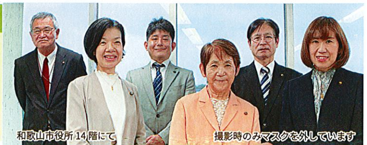
和歌山市役所14階にて