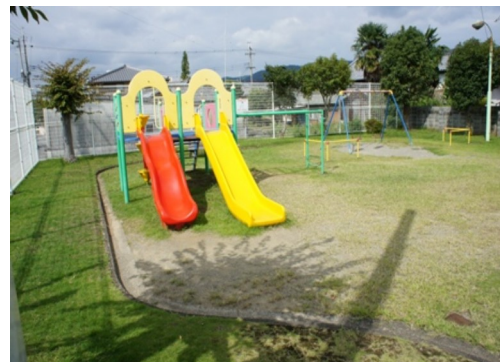
中筋日延児童遊園

この議案は、1973年に工事が完了した、中筋日延にある山口団地の宅地造成に伴い作られた児童遊園用地の登記簿上の所有者が市に対し、公園の明け渡しと遊具・防火水槽などの撤去と賃貸借料の請求がされたことについて、530万1千円の和解金を支払って解決しようというものです。この団地は工事が完了した時点で、公園や道路など公共施設は市に寄付されており、地目も「宅地」から「公園」に変更されています。造成による公園や道路などは工事完了の公告の翌日に市に帰属（市の所有になる）するとなっていますが、市は本来すべき登記をしていませんでした。しかし、この公園は、造成以来現在まで、市の児童遊園として市が管理しており、このような不当な要求には、毅然と対応すべきです。