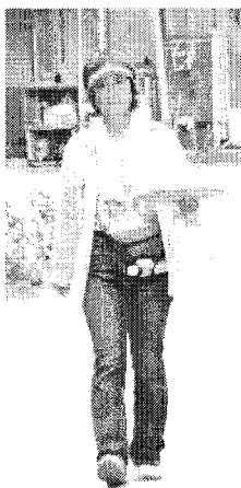
陸前高田市で 訪問活動中