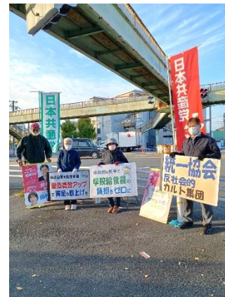
中之島ロータリーで