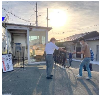
布施屋駅でアンケート配布