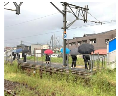
傘をさして電車を待 つ高校生 (布施屋駅)

答弁 駅構内の待合施設やト イレなどは駅利用者の利便性 向上のために設置するもので