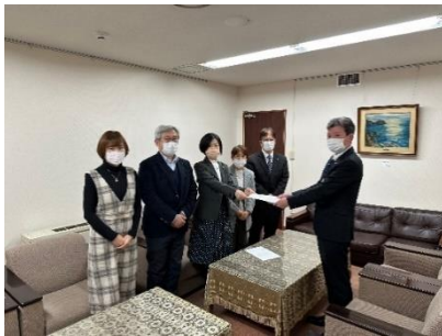
市議団で申し入れ