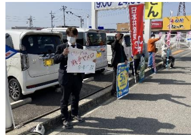
スーパー前で戦争ヤメロ