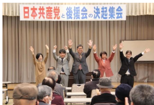
党と後援会の決起集会