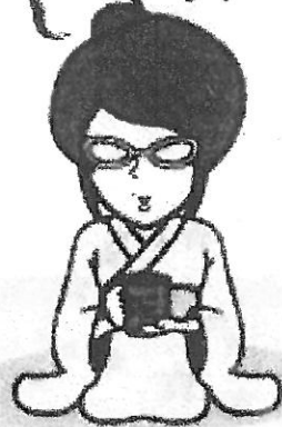
日本共産党 カナガワ支部HPの「雇用のヨーコ」