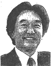
原やすひさ (参院選挙区)

を重ねてきました。耳を傾けてくれる人々に、なにをどう語るかを考えながら話をしてみました。涙を流しながら聴いてくれた人、駆け寄って握手を求めてくる人...。