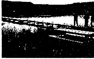
15.5haの自然観察エリアの中につくられた池(0.18ha)真ん中に木柵がかわらしています。

自然観察エリアの池のまわりには、梅やモミジ、松などが植えられています。周囲には、山と草原だけです。民間地との境界に木柵を設置し、来年度中にオープンすることです。