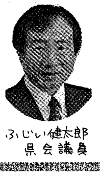
ふじい健太郎 県会議員