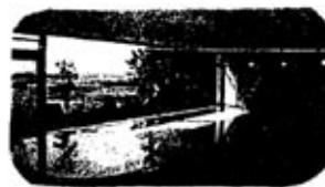
紀州三宮衆として人気、海が見える天然のみなべ温泉

宮前高山病院8:00・高松山A/Cや前8:15・和歌浦口バス停8:20・和歌浦福田農科前8:25・塚屋つたや前8:30・三基バス停8:40・紀三井寺バス停8:45・毛見バス停8:50・海南インター・南津町うめ振興館・国民協会紀州路みなべ、昼食、休憩・海産物販売店・道成寺、拝観、「絵とき説法」 道成寺発16:00ごろ・各地停車17:00~17:30ごろ うめ振興館(梅の歴史などをわかりやすく展示しています) 紀州路みなべ(天然温泉に入り、食事をします。海が眼下にひろがります) 道成寺(安珍・清姫で有名、仏像拝観、「絵とき説法」を聞きます)