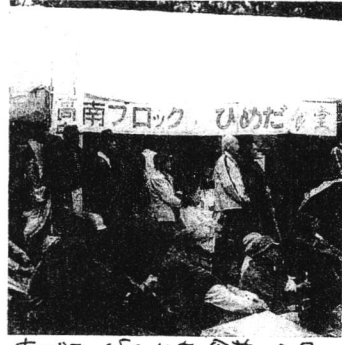
南ブロック「ひめだ食堂」全景