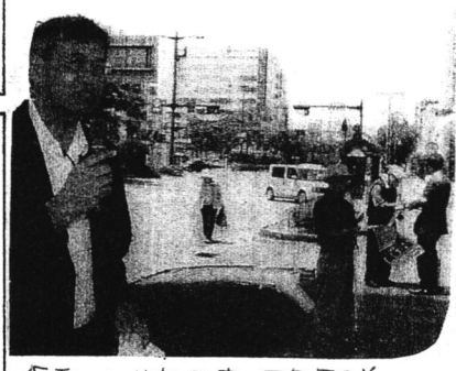
私、ひめだです。JR馬場前