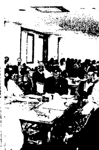
会場いばい 117名の参加者