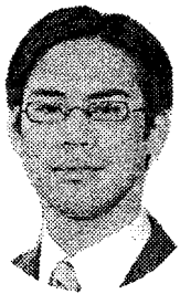
吉田まさや (参院選区)

パートやアルバイトで働い ていて、2人に1人は年収 2百万円以下です。パート で介護の仕事をしている26 歳の青年は、年収は150 万円以下で、「昇給がない ので、青年はすぐにやめて しまう。技術が受け継がれ ない」と深刻な実態を話し てくれましたが、これでは とても将来に希望をもて