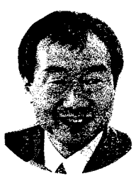
ふじい健太郎 県会議員