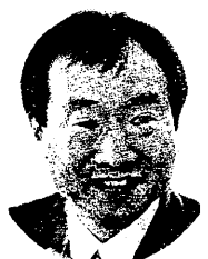
ふじい 健太郎 県議員