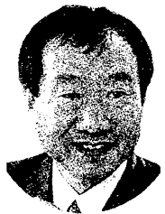
ふじい健太郎 県会議員

コスモパーク加太は関西国際空港/期建設用の埋め立て土砂を採取した跡地(252ha)です。県は土地開発公社所有地の108haを560円