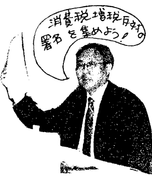
（講師のくにしげ秀明氏）

税を転嫁し負担がないのに戻し税によって大企業は大きくにしがさんは、現在の消費税増税反対の署名を集めよう