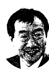
県会議員 藤井健太郎