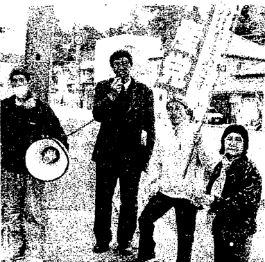
和歌浦後援会のみなさんと

日本共産党和歌浦後援会がハンドマイク宣伝 国会で予算が成立したら いつ解散・総選挙になっ てもおかしくないと言われ ています。