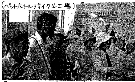
(ペットボトルリサイクル工場) 多くにげぬ ひめだ 大川橋 市青岸 松田商店

最初の見学は、(株)松田商店。ペットボトルリサイクル工場では、ペットボトルを洗い細かくしたものを、ペットフレイクをつくり、そ水を熱でこかして洗面器