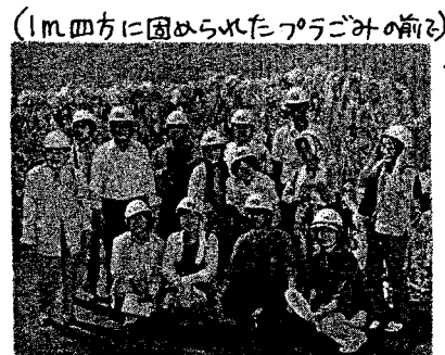
(1m四方に詰められたプラごみの前) 会場の主婦は新日本共産党

てあり、それでも資源になるのかと驚きました。子ども向けにロボットやビデオを使った環境学習には、年間5千人も来場するとか。この水にも驚きました。おとも楽しんでます。