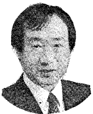
ふじい健太郎 県会議員