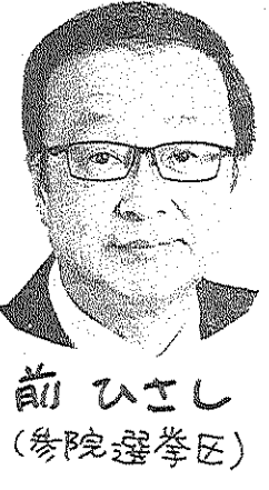
前 ひとし (参院選 孝臣)

倍にもなり、世界でも最も米産量が多い。日本共産党が新憲法草案を批判し、新憲法草案の是非をめぐっての座談会が開かれた。参加者は約30人。新憲法草案の是非をめぐっての座談会が開かれた。