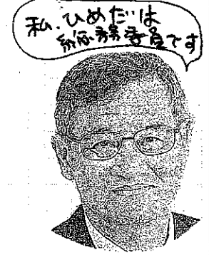
私、ひめだは お名前を覚えてます

ールは木の香が漂うのはイ イ感じでしたが、座席が狭 くてホントに残念。座って 見ざる座席のたまたま考 えなかつた私自身のウカツ さに身が縮む思いでしたが、 それをも狭かつたあ!